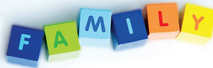
FIGURE PROFESSIONALI CHE OPERANO NEL CONSULTORIO FAMILIARE

Ginecologhe, Ostetriche, Infermiera, Assistente Sociale, Avvocato, Sessuologa, Psicologi e Psicoterapeuti, Psichiatra, Psicopedagoga.