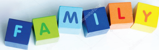
FIGURE PROFESSIONALI CHE OPERANO NEL CONSULTORIO FAMILIARE

Ginecologhe, Ostetriche, Infermiera, Assistente Sociale, Avvocato, Sessuologa, Psicologi e Psicoterapeuti, Psicopedagoga.